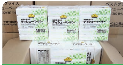
イオンリテール株式会社 イオン下妻店