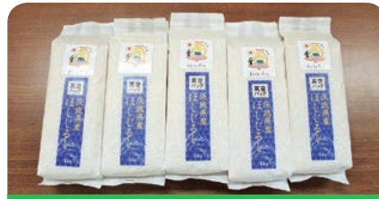
株式会社苅部農園