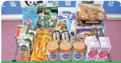
株式会社ダイナム 茨城下妻店