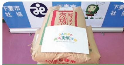
J A 常総ひかり 農業協同組合