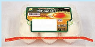
株式会社横浜ファーム 下妻農場