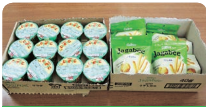
カルビー株式会社 下妻工場