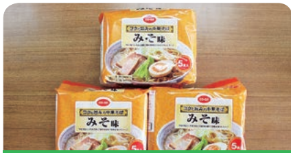
いばらきコープ生活協同組合